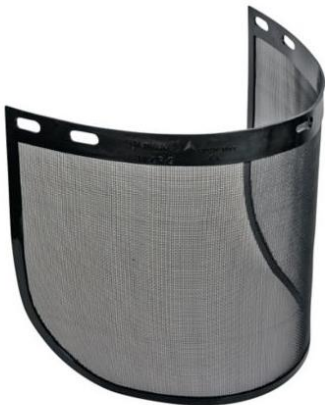
Viseira Metal Ref. 911514