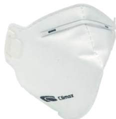
FFP 2 S/Válvula