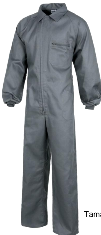
Fato de Macaco Cor: Cinza, Tamanhos: M-L-XL-XXL