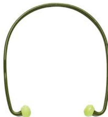
Tampão Auditivo Ref. 910348