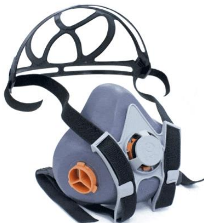
MEDOP – AIR II ref. 913845 (S/Filtro)