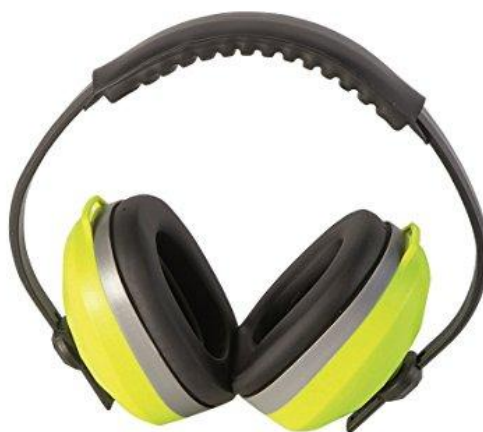
Protector Auditivo SNR 29 Ref. 911259