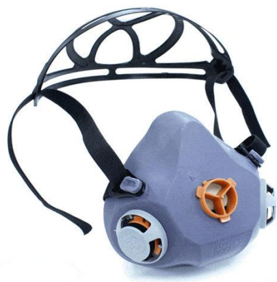
MEDOP – AIR I ref. 913844 (S/ Filtro)