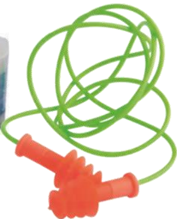
Protector Auditivo SNR29 Ref. 911025