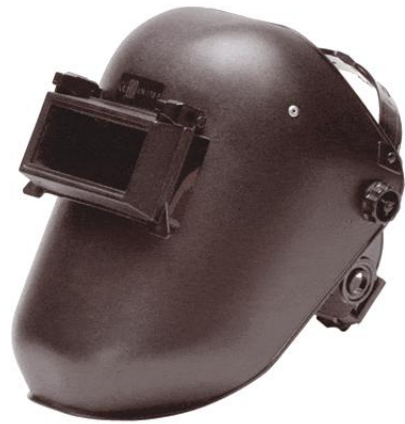
Máscara de Soldador Ref. 911725