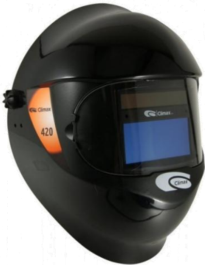
Máscara de Soldador Automática com ajuste lateral 100x41mm Ref. 420