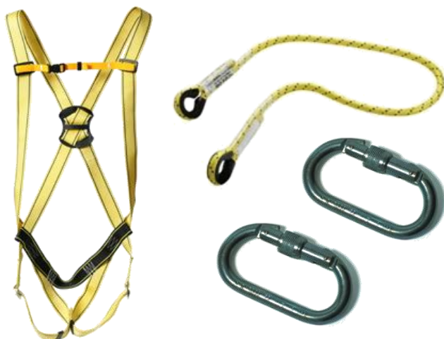
Conjunto ELBRUS 50