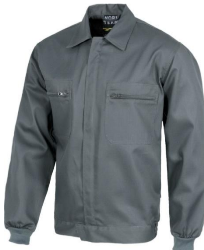
Casacos Trabalho Cor: Cinza; Tamanhos: L-XL-XXL