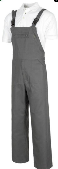
Jardineiras Cor: Cinza Tamanhos: M-L-XL-XXL