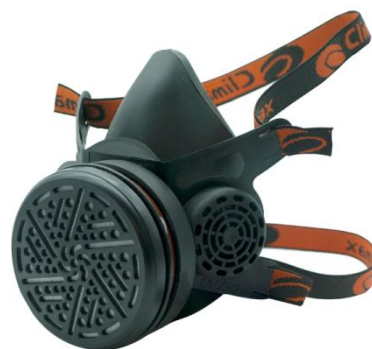
Climax ref. 745 (C/ Filtro P3)