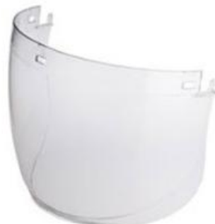
Viseira Transparente Ref. 906941