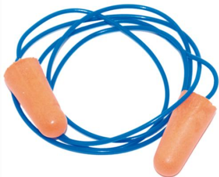
Tampão Auditivo c/Corda SNR38 Ref. 13 E C/C