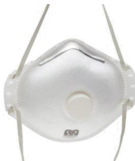
FFP 2 C/Válvula