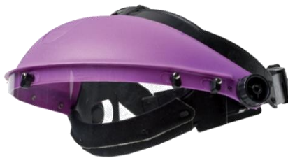
Adaptador ( ADAPTARAMA) Ref. 906938