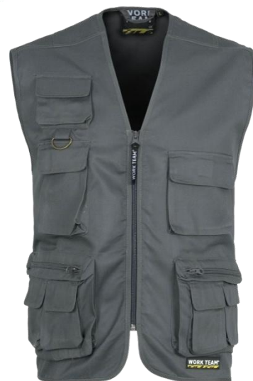
Colete de Trabalho C/ Bolsos Cor: Cinza, Tamanhos: M-L-XL-XXL