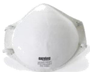
FFP 1 S/Válvula