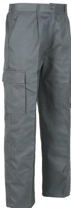
Calças de Trabalho c/bolsos Cor: Cinza; Tamanhos M-L-XL-XXL