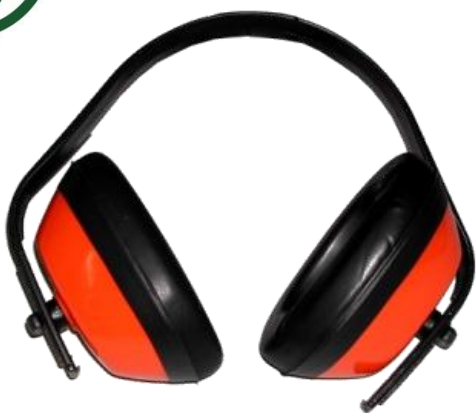
Protector Auditivo SNR 25 Ref. 902872