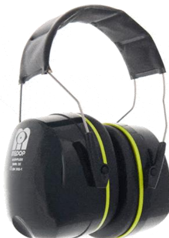
Protector Auditivo SNR32 Ref. 911139