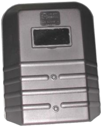
Máscara de Soldador Ref. 410 - I