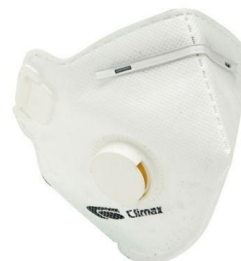
FFP 2 C/Válvula